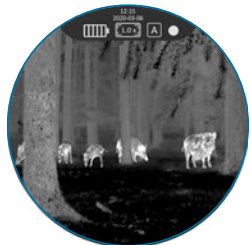
Vorsatzgerät-Modus NOBLEX® NW 100