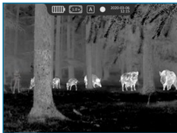
Monokular Modus – Vollbild